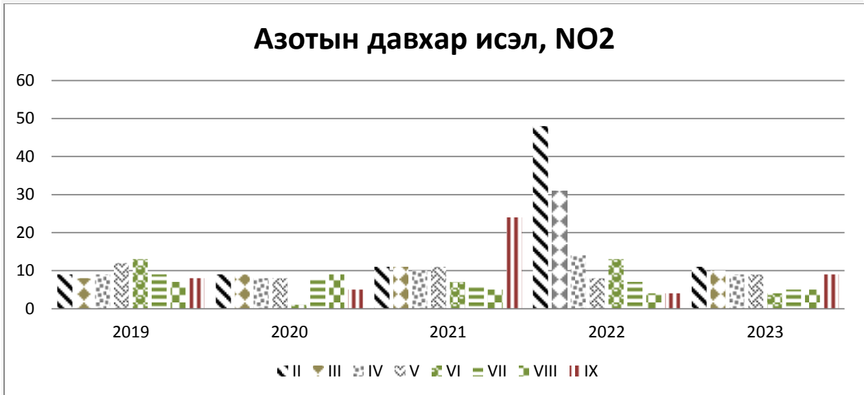
Зураг 2. Азотын давхар ислийн дундаж агууламж, 2019-2023 он

2023 оны 09 сарын азотын давхар ислийн сарын дундаж агууламж 9 \text{ мкг/м}^3 байсан ба 2022 оны мөн үетэй харьцуулахад 4 \text{ мкг/м}^3 -ээс 9 \text{ мкг/м}^3 болж өссөн байна (Зураг 2)