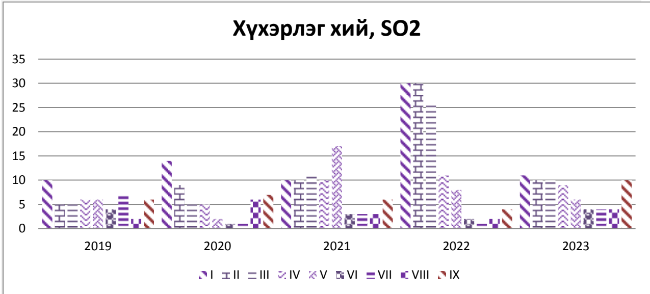
Зураг 1. Хүхэрлэг хийн сарын дундаж агууламж, 2019-2023 он

2023 оны 09 сарын хүхэрлэг хийн сарын дундаж агууламж 10 \text{ мкг/м}^3 байсан ба 2022 оны мөн үетэй харьцуулахад 4 \text{ мкг/м}^3 -ээс 10 \text{ мкг/м}^3 болж өссөн байна (Зураг 1)